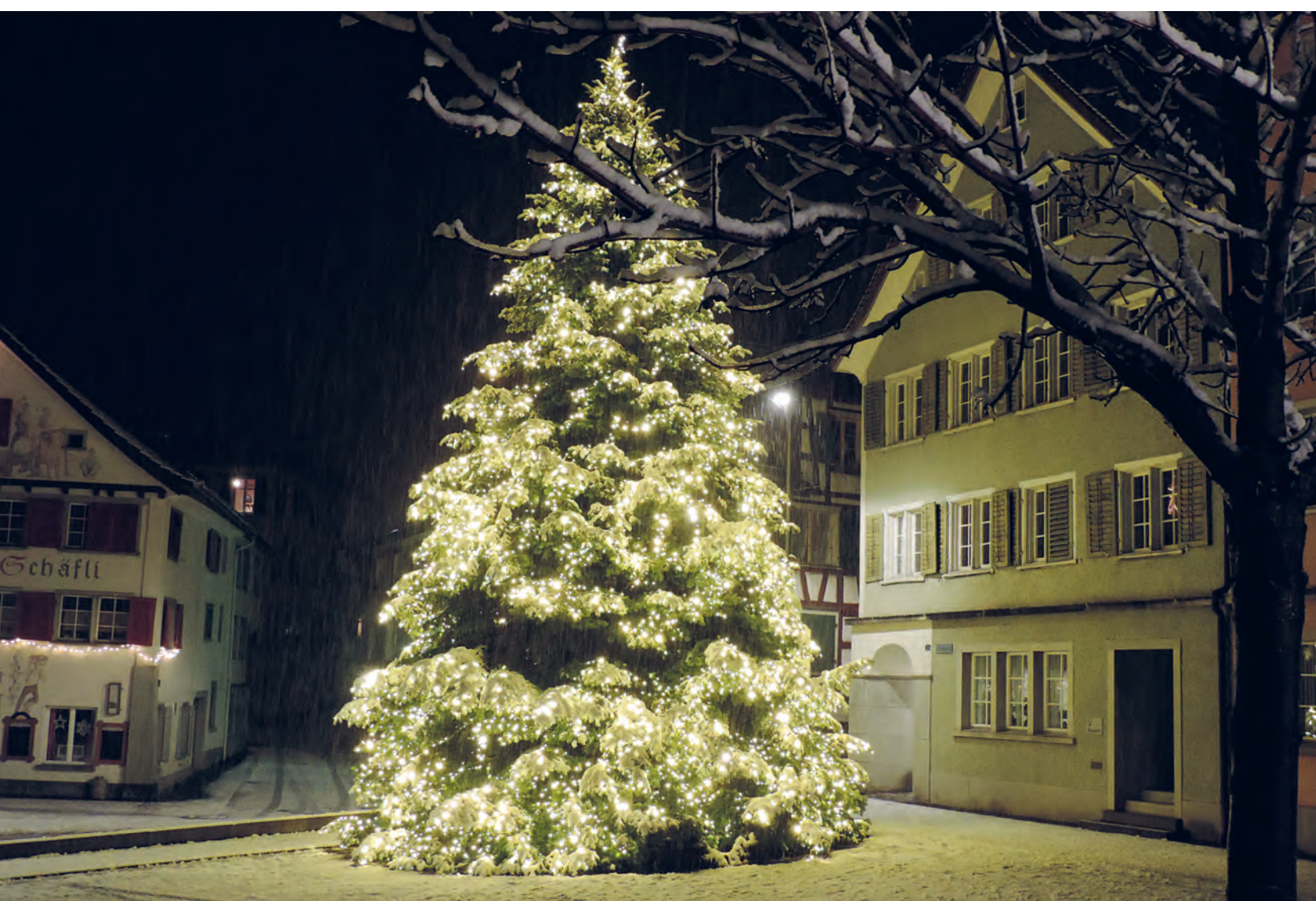
Rathausplatz im Jahr 2020

Informationen der Politischen Gemeinde, Mitteilungen der Vereine, Aktuelles aus Thal, Staad, Buechen und Altenrhein