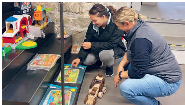
Spieleberatung für Eltern: Grosses Sortiment an Kleinkinderspielen entdecken.

Der Spielmorgen ist für alle kostenlos und es ist keine Anmeldung erforderlich. Die Ludothek Rheineck hat offen für alle interessierten Kinder und Eltern. Einfach vorbeischaun! Das Ludo-Team freut sich auf viele neugierige Besucherinnen und Besucher und einen Vormittag voller Spielfreude und Entdeckungen.