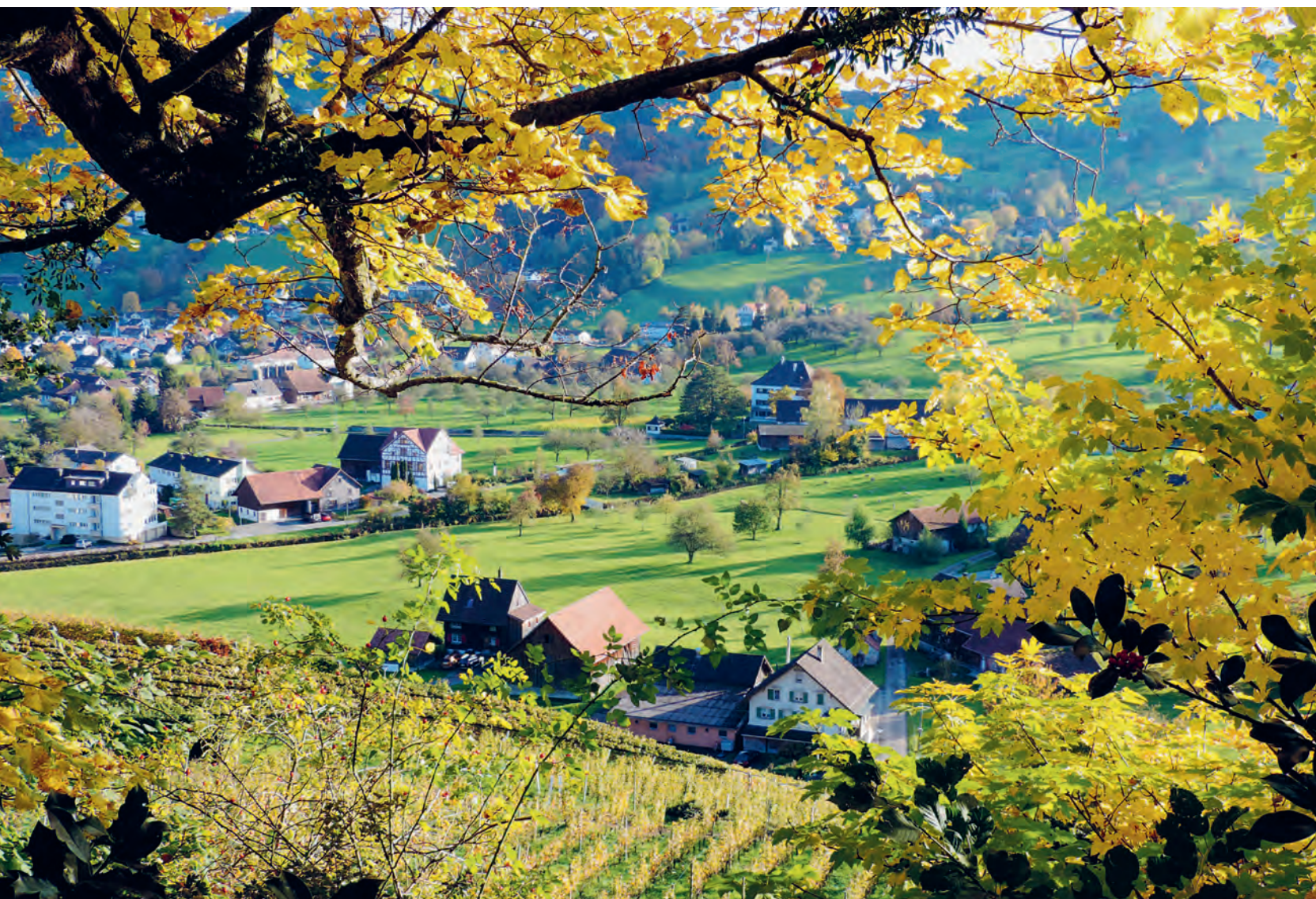
Blick vom Buechberg auf Thal

Informationen der Politischen Gemeinde, Mitteilungen der Vereine, Aktuelles aus Thal, Staad, Buechen und Altenrhein