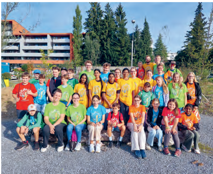
Die Thal'r Ministranten waren Teil vom grossen Mini-Fest in St. Gallen

Siehe Text gemeinsame Seite aller Pfarreien.