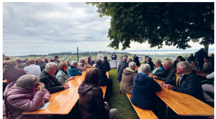
Mit dem Dorf Thal und dem Steinigen Tisch im Hintergrund feierten wir den Auffahrtsgottesdienst im Bildschachen.

Siehe Text gemeinsame Seite aller Pfarreien.