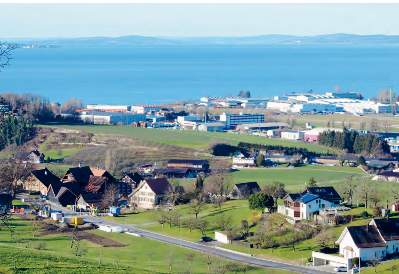
Blick vom Buechberg

Informationen der Politischen Gemeinde, Mitteilungen der Vereine, Aktuelles aus Thal, Staad, Buechen und Altenrhein