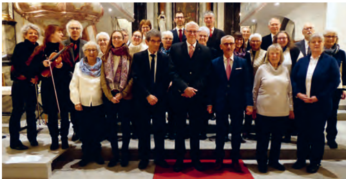
Der Chor bei «Wort und Musik» im Jahr 2023

Der Eintritt ist frei, es wird eine Kollekte erhoben.