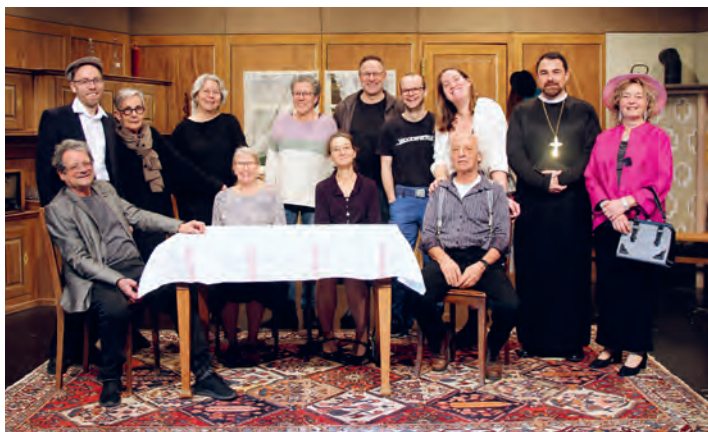
Aufnahme vom letztjährigen Auftritt